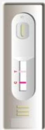
Pozitívny výsledok nízka koncentrácia hemoglobínu v stolici